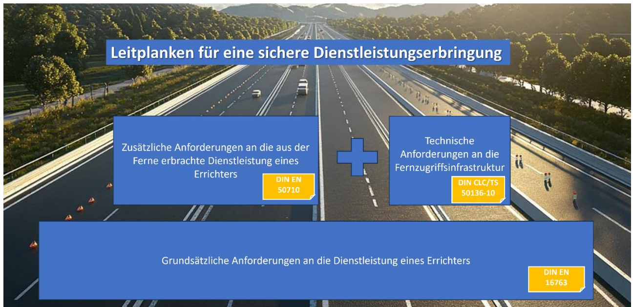
Abbildung 2: Normatives Umfeld für die Erbringung von Dienstleistungen an Sicherheitsanlagen

Grundsätzliche Anforderungen an die Dienstleistung eines Errichters sind in der DIN EN 16763 beschrieben. Diese gilt unabhängig vom Ort der Dienstleistungserbringung. Soll eine Dienstleistung teilweise oder ganz aus der Ferne erbracht werden, gelten diesbezüglich die Anforderungen der DIN EN 50710. Die grundlegenden technischen Anforderungen der DIN EN 50710 werden durch die DIN CLC/TS 50136-10 konkretisiert.