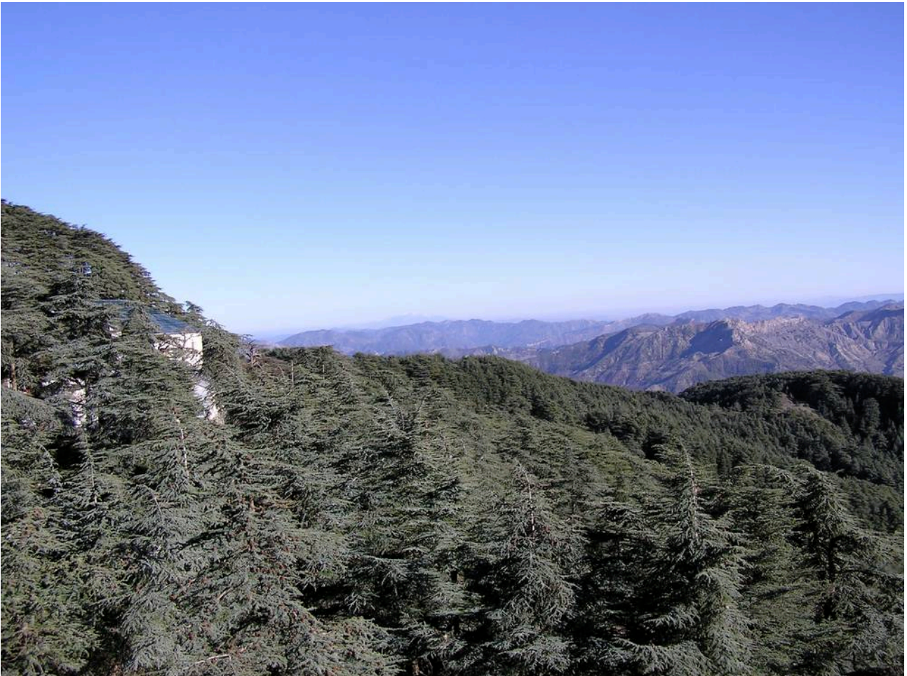
Vielfältigste Natur in Algerien - vom Wüsten- bis zum Gebirgsklima

Algerien ist flächenmäßig (nach der Teilung des Sudan) das größte Land Afrikas (ca. 6,5 mal größer als Deutschland), besteht allerdings zu 85% aus Wüste im Süden, steinigen Hochplateaus im Zentrum und fruchtbaren, teilweise stark bergigen Regionen im Norden. Die Rohstoffvorkommen gelten noch für ca. 30 Jahre als ausreichend - bei gegenwärtigen Bedingungen.