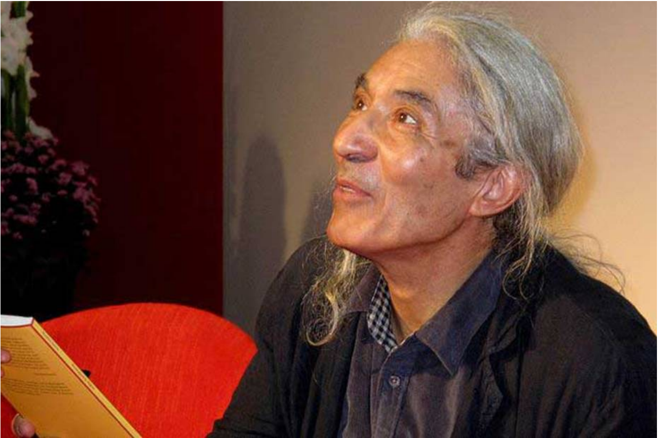
Boualem Sansal