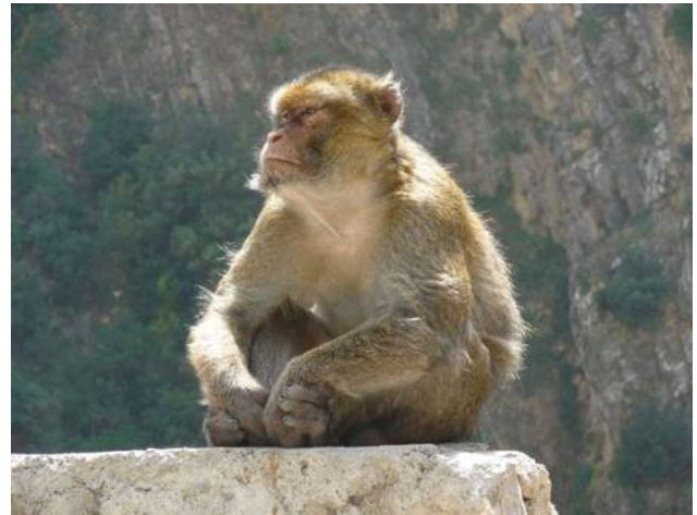
Berberaffe bei Algier