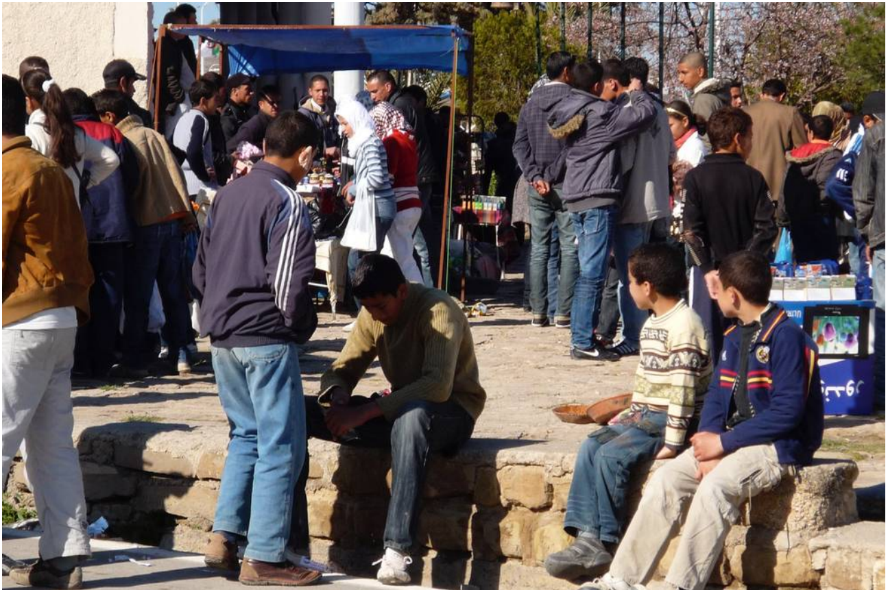
Schwieriger Alltag in Algerien

Die Einreise ist nur mit Visum auf Antrag möglich; die Länge der Aufenthaltsberechtigung kann je nach gegenwärtiger politischer Opportunität variieren. Bei Langzeitaufenthalten ist eine Vielzahl von Vorschriften zu beachten, angefangen von der Arbeitserlaubnis über die Kfz-Zulassung bis hin zum Mietvertrag. Die Landeswährung wird intensiv auf dem Schwarzmarkt gehandelt.