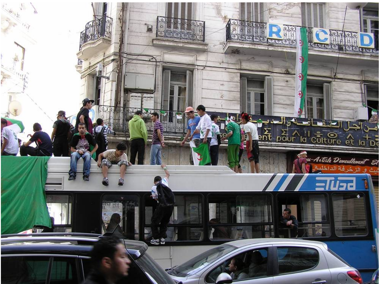
Land der Freude und des Taumels: Qualifikation für die Fußball-WM 2010

Die durch Kolonialismus, islamischen Terror und Bürgerkrieg traumatisierte Gesellschaft ist auf der Suche nach der eigenen Identität. Einparteiensstaat und Sozialismus sind im Bewusstsein der algerischen Bevölkerung genauso gescheitert wie ein umfassender politischer Machtanspruch des Islam. Die westliche Demokratie lässt sich nicht einfach importieren; Algerien muss seinen eigenen Weg finden.