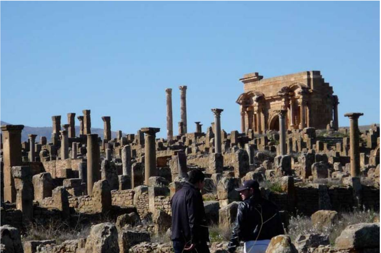
Die Ruinen von Timgad