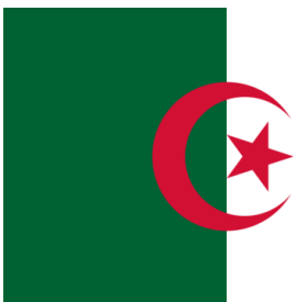
Die Staatsflagge (Public Domain, Public Property)