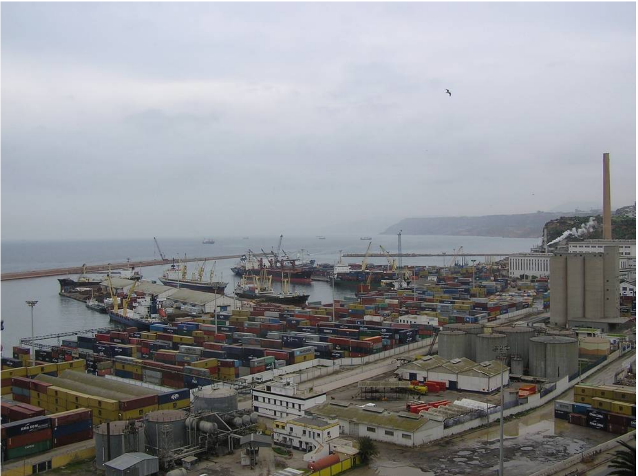
Im- und Export, die Lebensadern der algerischen Wirtschaft

Die algerische Volkswirtschaft ist ihrer Struktur nach eine staatlich dominierte Rentenwirtschaft auf Basis von Erdöl und Erdgas. Algerien ist viertgrößter Erdgas- und zehntgrößter Erdölproduzent der Welt. Die algerische Wirtschaft ist wenig diversifiziert. Nahezu alle Konsum- und Industriegüter werden aus dem Ausland bezogen. Der Privatsektor gewinnt nur langsam an Bedeutung.