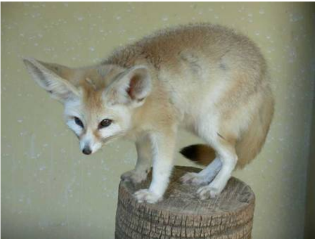
Wüstenfuchs (Fennec)

Wüstenspringmäuse und Skorpione angepasste Lebensbedingungen.