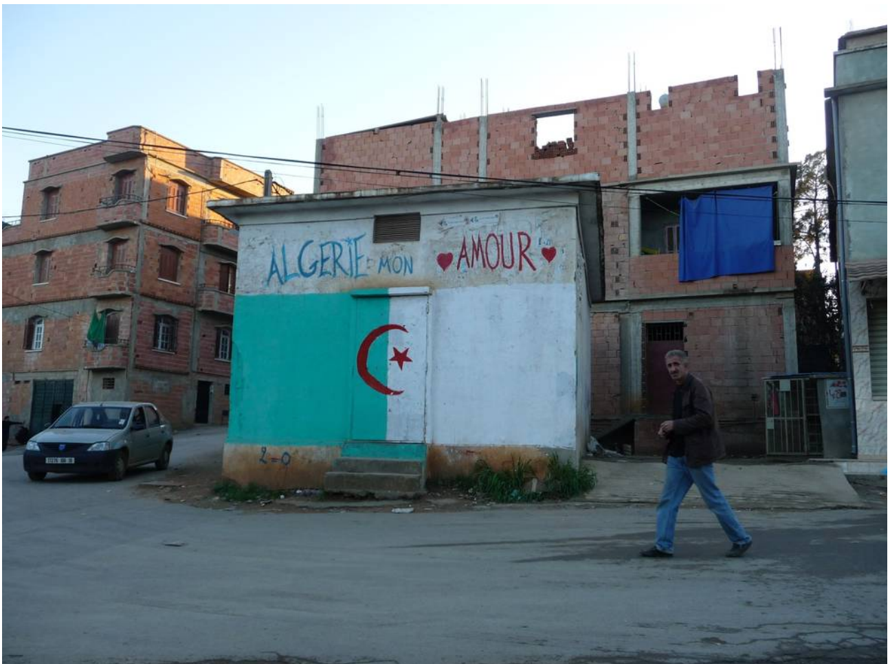
Stolz auf das Land - wenig Hoffnung für die Zukunft

Weit vor der islamischen Eroberung wurde Algerien von seinen ursprünglichen Einwohnern, den Berbern, bewohnt. Nach dem Ende des römischen Reiches gerieten sie unter arabische Herrschaft und nahmen den Islam an. Nach 1830 wurde Algerien für 132 Jahre kolonisiert (ab 1848 als "Département Outre Mer") und befreite sich davon in einem traumatisierenden, blutigen Unabhängigkeitskrieg.