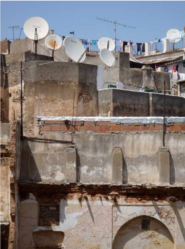
Satellitenschüsseln in Algier

Demokratie, Transparenz, freie Meinungsäußerung und freie Medien stellen in der jüngeren algerischen Geschichte die Ausnahme dar und nicht die Regel, da sie die Herrschaft des Regimes und der von ihm profitierenden Eliten in Frage stellen können. Nach 1988 kam es aber unter dem Druck der Verhältnisse zu einer Öffnung im Pressewesen; zahlreiche Zeitungen und Zeitschriften wurden gegründet.