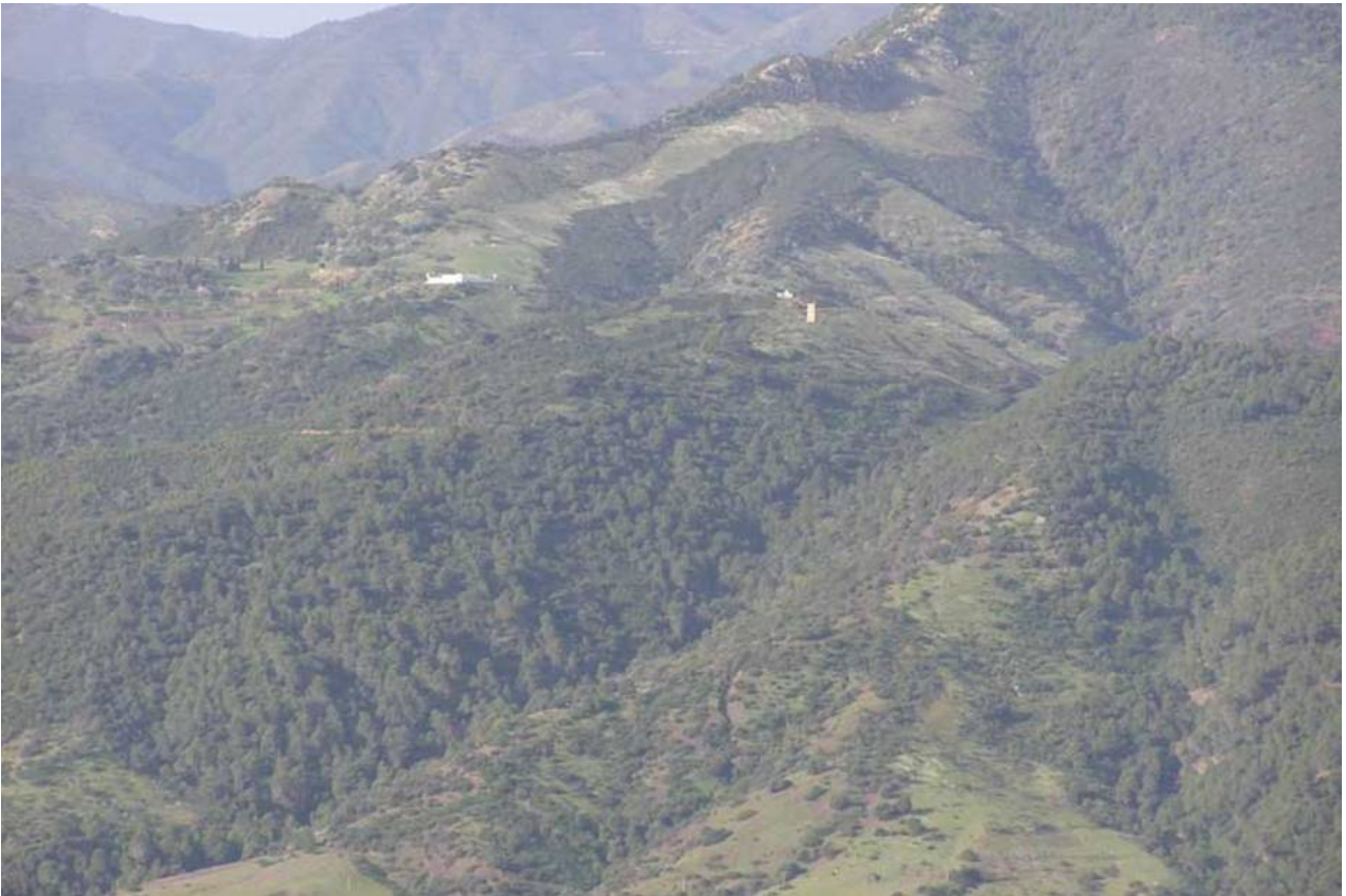
Besonders in der Kabylei finden sich schroffe, niederschlagsreiche Bergwälder

In den Wüstengebieten ist es sehr trocken, die Temperaturunterschiede zwischen Tag und Nacht können im Extremfall bis zu 50 Grad betragen. Die Oasen zeichnen sich vielfach durch ein besonderes, relativ mildes Mikroklima aus.