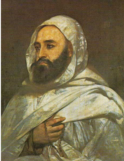
Emir Abdelkader

Länder im Zuge von Renaissance sowie der Entwicklung von Handwerk, Manufaktur und Industrie verlor der Raub von Sklaven und die Piraterie zunehmend an Bedeutung, das "Geschäftsmodell" der Korsaren war nicht mehr zeitgemäß. Es kam zu einer starken Verschuldung des algerischen Deys gegenüber Frankreich, um die ständig steigenden Importe an europäischen Waren finanzieren zu können.