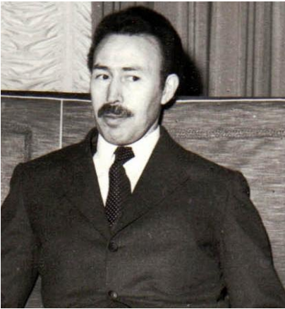
Houari Boumedienne

Atomkraft zu machen, erreicht hatte. Algerien war für Frankreich entbehrlich geworden, sein Verlust verkraftbar.