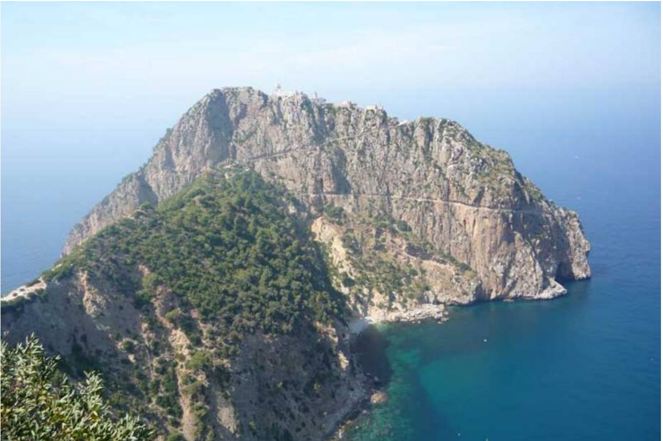
Meeresperspektive bei Bejaja