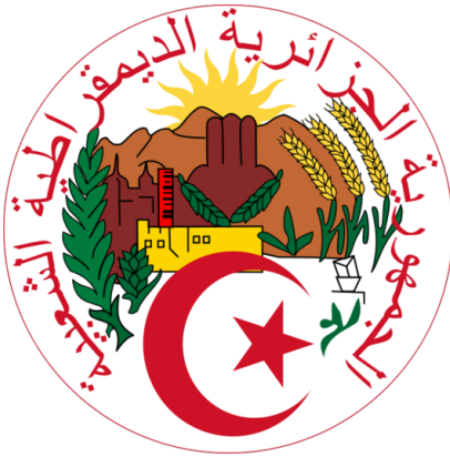
Algerisches Staatssiegel